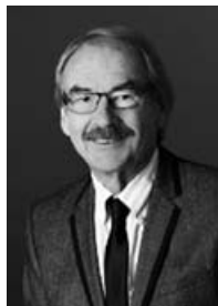
Manfred Schmock Gewerbeverein