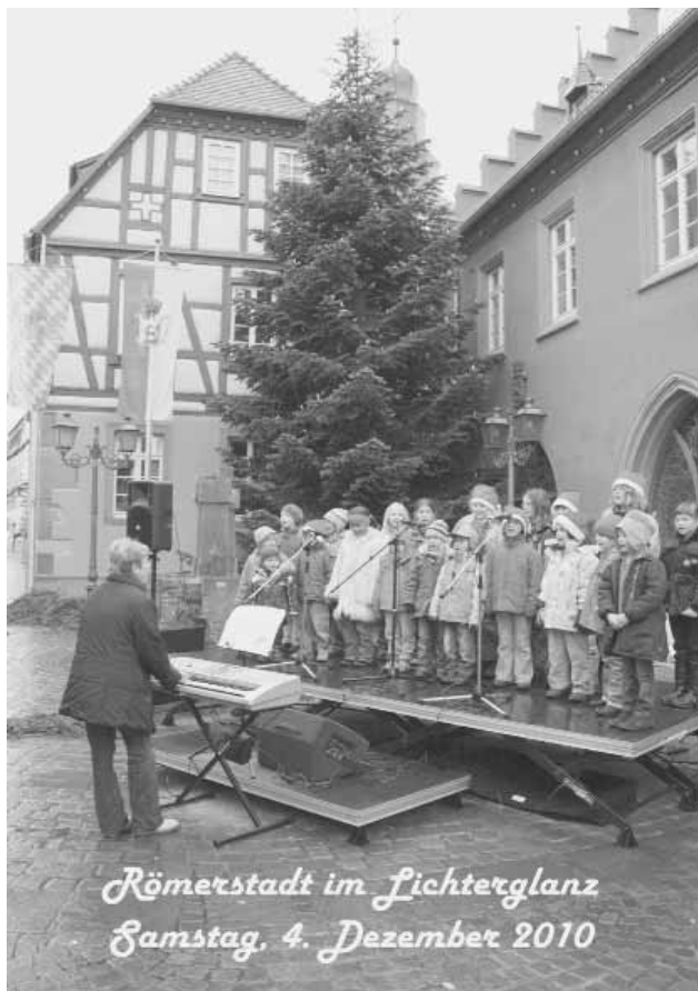
Römerstadt im Lichterglanz Samstag, 4. Dezember 2010