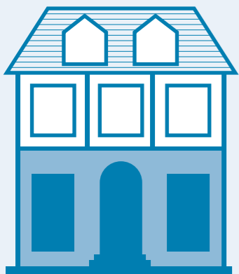
Geschäftsflächen im Erdgeschoss