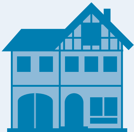
Außengestaltung von Haus und Hof