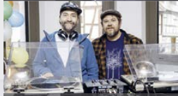
♪ Soundsystem | B-OBB