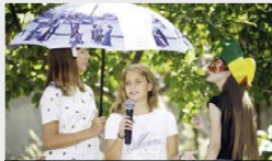
15 h Rosengarten Theaterverein