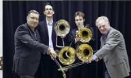
♪ 15.30 + 16.30 h EASY SLIDERS Posauenquartett | Semmlers