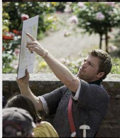
13.30 h Römische Stadtführung