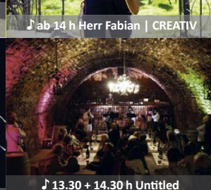
♪ 13.30 + 14.30 h Untitled Der Junge Chor | Semmlers