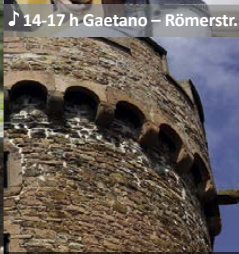
Runder Turm geöffnet