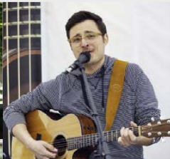
♪ 14-17 h Gaetano – Römerstr.