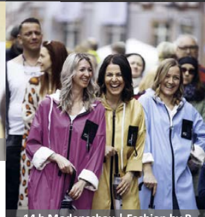
14 h Modenschau | Fashion by B