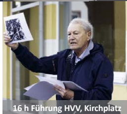
16 h Führung HVV, Kirchplatz

XXXLutz – Viele Angebote & buntes Kinderprogramm